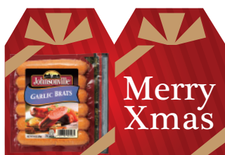
ガーリックブラッツ