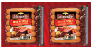
ホットアンドスパイシー