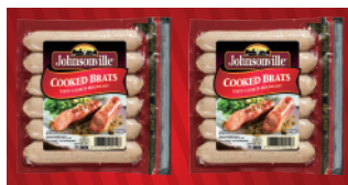
クックドブラッツ