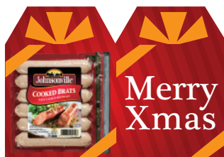
クックドブラッツ