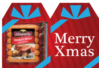
スモークブラッツ