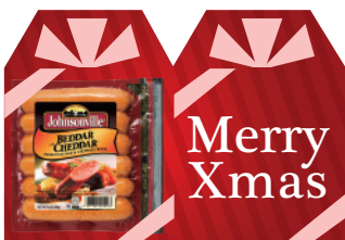
ベダーウィズチェダー