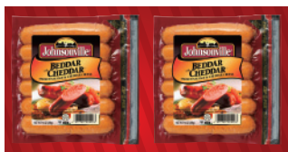
ベダーウィズチェダー