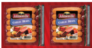
ガーリックブラッツ