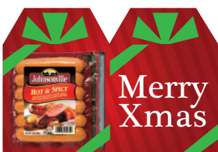
ホットアンドスパイシー