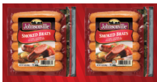
スモークブラッツ